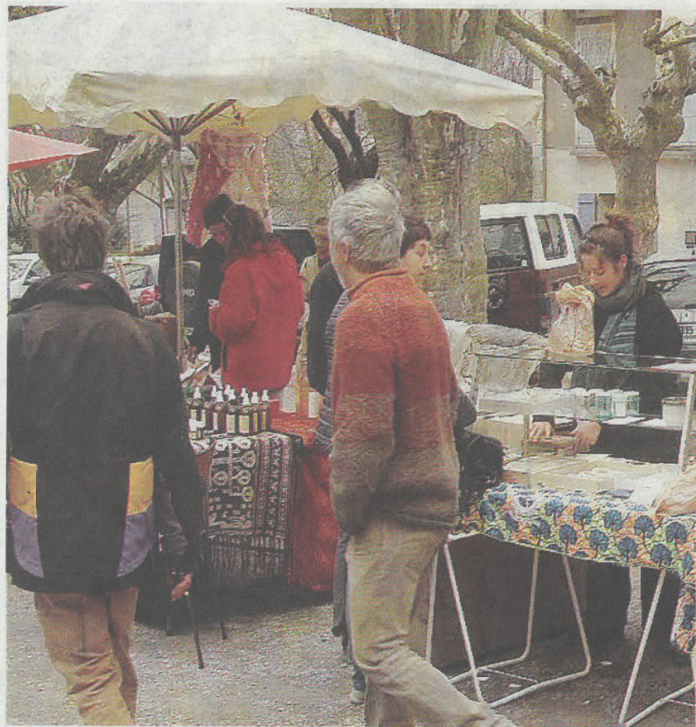
Premier rendez-vous ce vendredi 22 avril à Thoard.