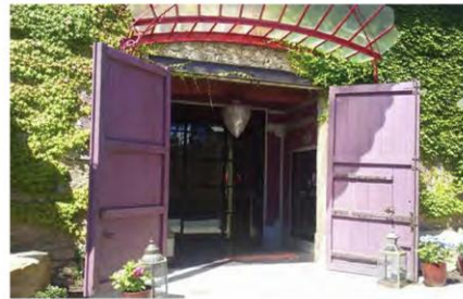
Exemple d'entrée accessible