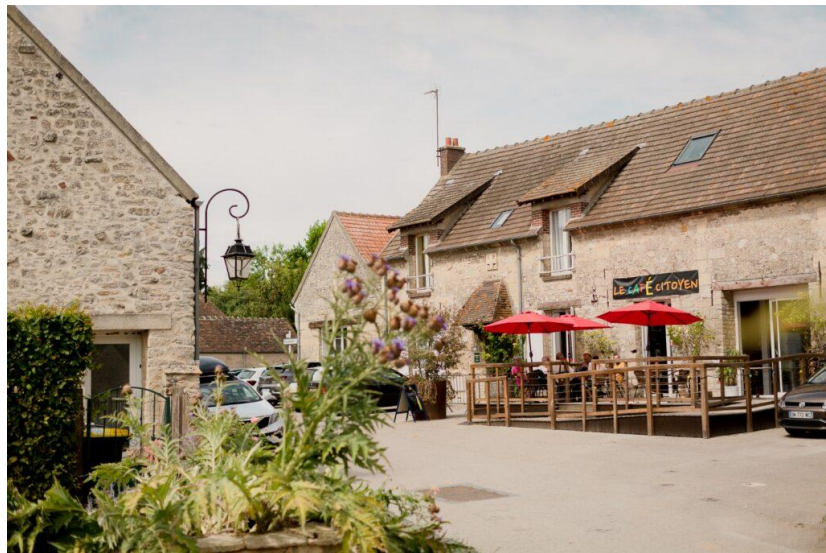
Le Café citoyen à St Auger-St-Vincent (Oise)