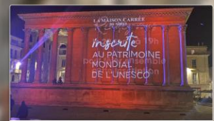
PROTRAIT COEUR DE NÎMES La Maison Carrée inscrite au patrimoine mondial de l'Unesco...