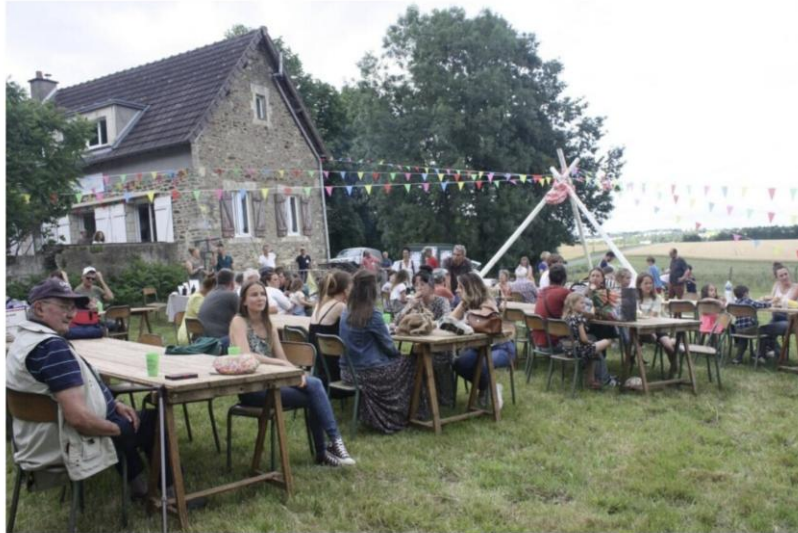
Les habitants de Seulline (Calvados) étaient invités à venir partager un pique-nique pour fêter le premier anniversaire de leur épicerie participative, samedi 27 juin 2025.