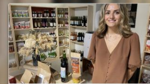
PROTRAIT A La Végétale Première épicerie fine vegan du Gard