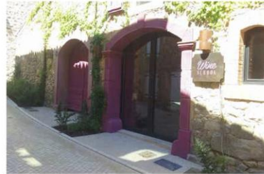
Exemples d'utilisation de la couleur et de signalétique renforçant l'identité visuelle de l'opération