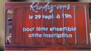
PROTRAIT COEUR DE NÎMES Vendredi 29 septembre, soirée spéciale Unesco au pied de la M...